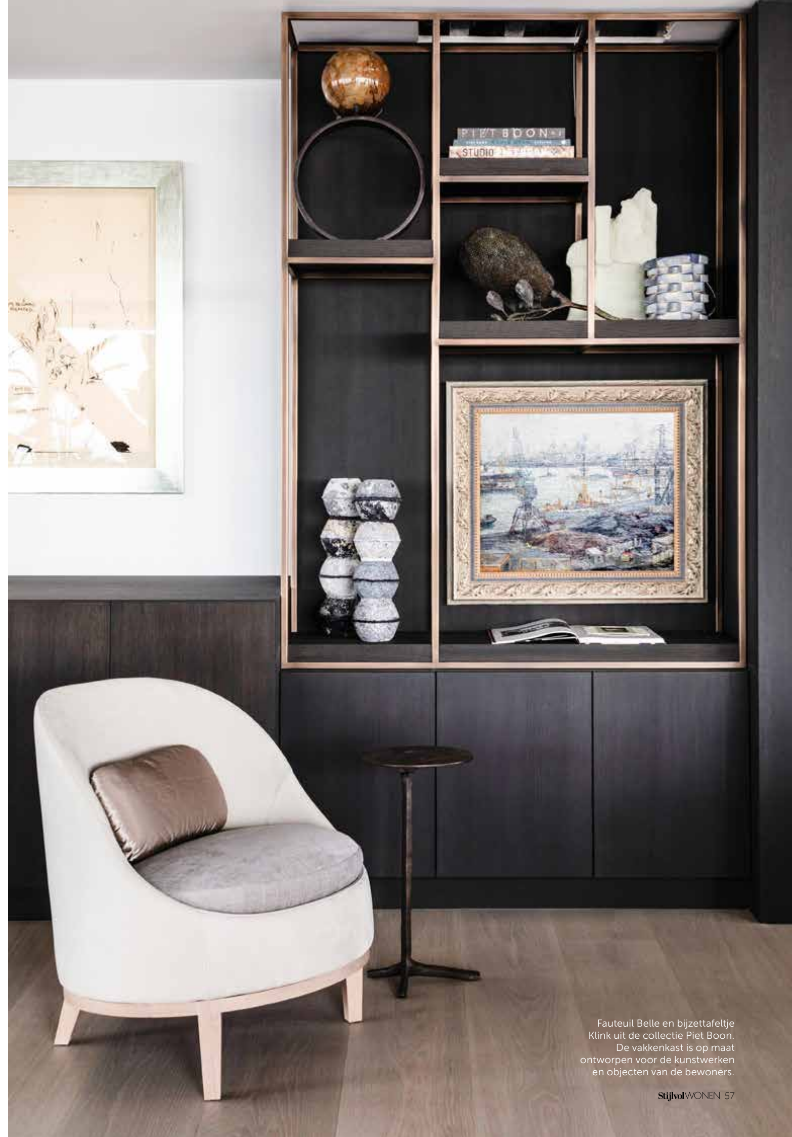
Fauteuil Belle en bijzettafeltje Klink uit de collectie Piet Boon. De vakkenkast is op maat ontworpen voor de kunstwerken en objecten van de bewoners.

Wat wel opvalt, is dat het hart van de woning is uitgevoerd in donkere kleuren. Piet Boon: "Door de kern donker te houden en de ruimte naar buiten toe lichter te maken, ontstaat een interessante spanning." Subtiele spanning ontstond ook door het combineren van glanzende en matte materialen. In de masterbathroom bijvoorbeeld kozen ze voor één soort natuursteen maar dan wel uitgevoerd in verschillende afwerkingen, van verzoet en geborsteld tot ruw. Een thuis realiseren dat beter is dan de droom van de bewoners, dat is het streefdoel. Piet: "Het grootste compliment dat je kunt krijgen? Dat eigenaars zeggen: dit is zo van mij, het past helemaal bij ons."